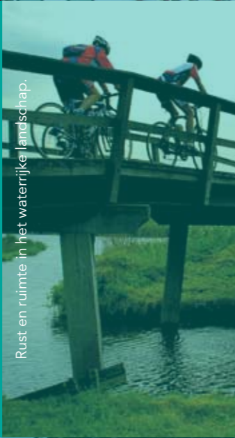
Rust en ruimte in het waterrijke landschap.

Op de website MijnZaanstreek.nl kan iedereen zijn trots op de Zaanstreek verbeelden via foto's, video's en verhalen. Onlangs vierde de website haar éénjarig bestaan. De website telt inmiddels 340 leden en ruim 10.000 foto's. Deze foto's tonen mooie en vaak onverwachte plekjes en details. Van de rijke historie, de ontwikkelingen in het centrum en het waterrijke landschap. De Zaanstreek heeft het allemaal!