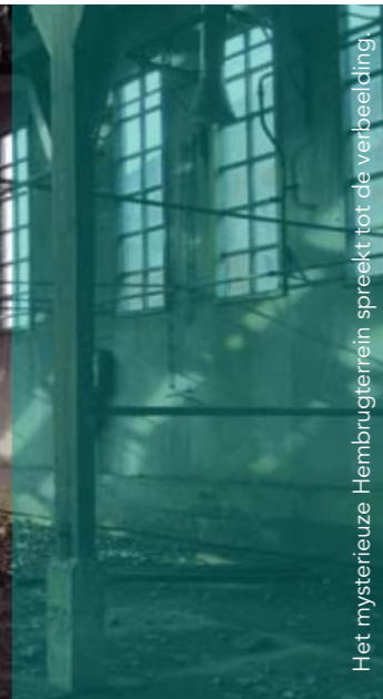
Het mysterieuze Hemburgerrein spreekt tot de verbeelding.

"Mijn stad, mijn stad, eerst, vervuilden, je jaren, je water en nu reanimeren, je jouw hart!"