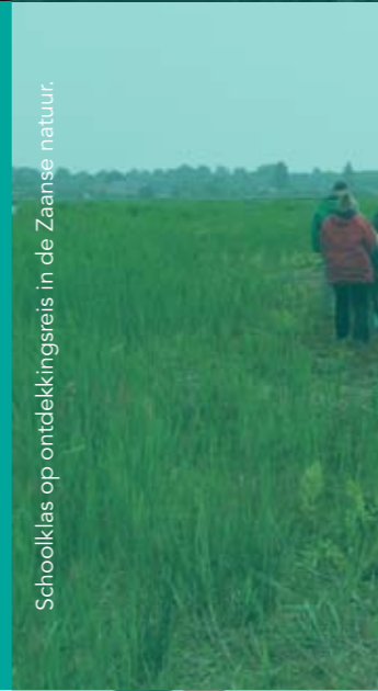
Schooiklas op ontdekkingsreis in de Zaanse natuur.