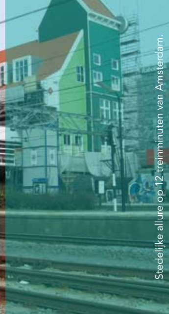
Stedelijke allure op 12 treiminuten van Amsterdam.